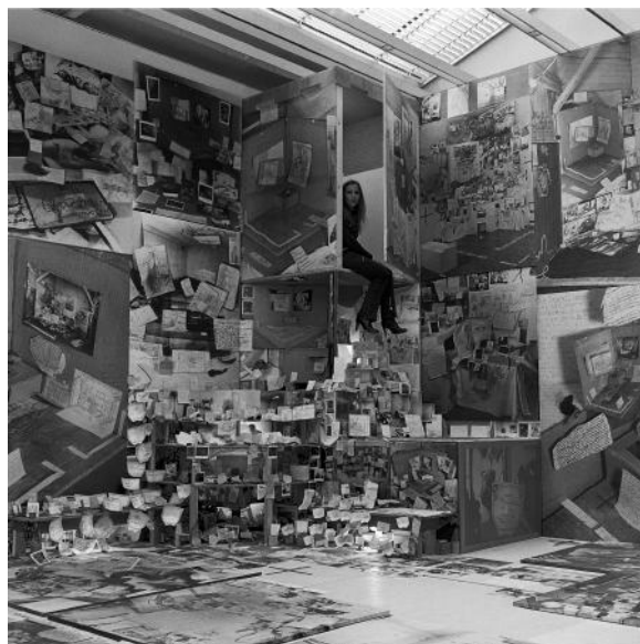
Anna Oppermann, Vue de l'artiste dans son installation Problemlösungsauftrag an Künstler (Raumprobleme) au Musée d'Art Moderne de la Ville de Paris, 1981.

service-educatif@fracbretagne.fr ou par téléphone le mercredi après-midi au 02 99 84 46 10.