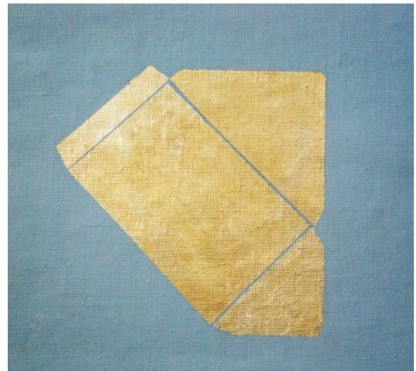
Karolina Krasouli, Sans Titre (détail), 2015 Courtesy de l'artiste.

beaux-arts@saint-brieuc.fr ou au 02 96 01 26 56