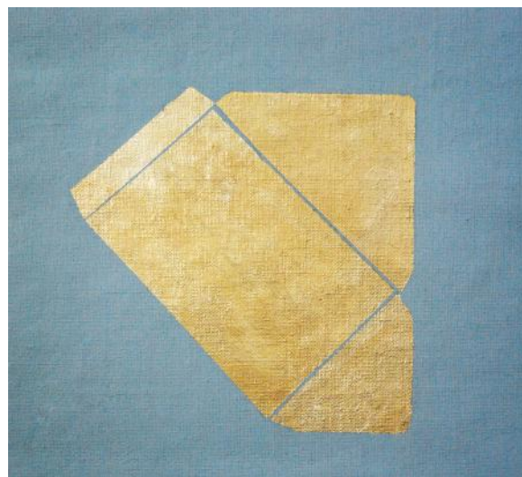
Karolina Krasouli, Sans Titre (détail), 2015 Courtesy de l'artiste. Photo : Karolina Krasouli.

beaux-arts@saint-brieuc.fr ou au 02 96 01 26 56